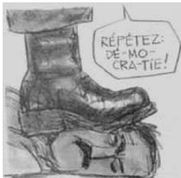
Pancho, Le Monde , 4 mai 2004

Pour eux c'est une première victoire. Comme quoi, même dans une situation noire, en se regroupant, on peut arriver à remporter des victoires collectives.